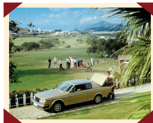
Later werd de 262C ook leverbaar in een zeer gedistingeerde goudkleur.

De geplande lage productieaantallen bewijzen dat Volvo zich er terdege van bewust was dat de 262C een nicheproduct is, waarvan men de bouw het beste kon uitbesteden aan een daarin gespecialiseerd bedrijf, Bertone in dit geval. Anders zouden de productiekosten astronomisch worden. Dus worden de carrosserieën van de 262, de motoren en alle technische onderdelen per vrachtauto van Göteborg naar Turijn vervoerd, waar ze worden aangepast en geassembleerd. De interieurs worden ter plekke vervaardigd door gespecialiseerde ambachtslieden op basis van Zweedse onderdelen. Deze exclusiviteit heeft wel zijn prijs: in 1980 kost de auto in Nederland 61.143 gulden, ruim tienduizend gulden meer dan de duurste 264.