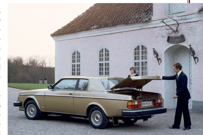
Elegant en exclusief

Volvo besluit gebruik te maken van de bestaande samenwerking en de coupé in kleine aantallen in Italië te laten bouwen. Men voorziet een productie van achthonderd stuks per jaar. Er wordt een tweede prototype gebouwd, nu op basis van de 262. Afgezien van de drie kroontjes op de C-stijl is die auto identiek aan het toekomstige seriemodel. Het dak is in zijn geheel overgenomen van het eerste prototype.