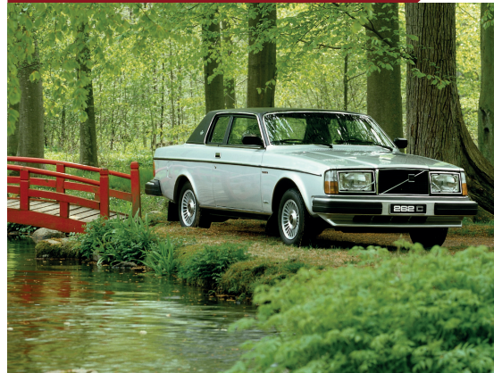
De 262C was aanvankelijk alleen leverbaar in het grijs met een zwart dak.

Door de verlaging van het dak passen de stoelen uit de 264/265 niet meer in het nieuwe model. In plaats van de bestaande stoelen aan te passen, ontwikkelt Volvo volledig nieuwe stoelen, die nog weelderiger en nog comfortabeler zijn. En ook wat lager, zodat de 262C toch rijkelijk hoofdruimte biedt. Het interieur is volledig bekleed met zwart leer en de binnenzijde van de deuren is voorzien van inlegwerk uit edel hout. De standaarduitrusting is uiterst luxueus voor die tijd, met onder andere een automatische transmissie, getint glas, elektrische bediening van de buitenspiegels, de antenne en de ruiten, verwarmde stoelen en vanzelfsprekend ook airconditioning. De versie van na 1979 heeft zelfs cruisecontrol.