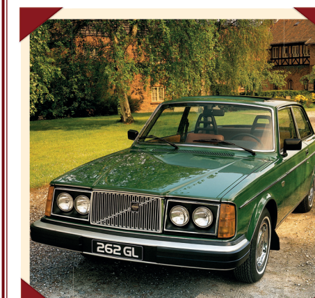
Een 262 GL (hier een Amerikaanse versie), het model dat als basis diende voor de 262C.

De definitieve versie wordt in maart 1977 gepresenteerd op de autoshow van Genève. De oplettende toeschouwer ziet daar dat carrosseriebouwer Bertone zijn logo op de voorspatborden bevestigd heeft en dat de drie kroontjes vervangen zijn door één enkel exemplaar. Om elke verwarring te voorkomen, plakt men een C achter de typeaanduiding 262.