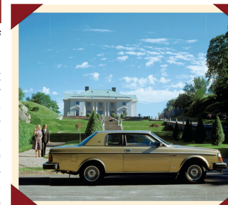
Op deze foto is goed te zien hoe sterk het dak werd verlaagd.

De definitieve versie wordt in maart 1977 gepresenteerd op de autoshow van Genève. De oplettende toeschouwer ziet daar dat carrosseriebouwer Bertone zijn logo op de voorspatborden bevestigd heeft en dat de drie kroontjes vervangen zijn door één enkel exemplaar. Om elke verwarring te voorkomen, plakt men een C achter de typeaanduiding 262.