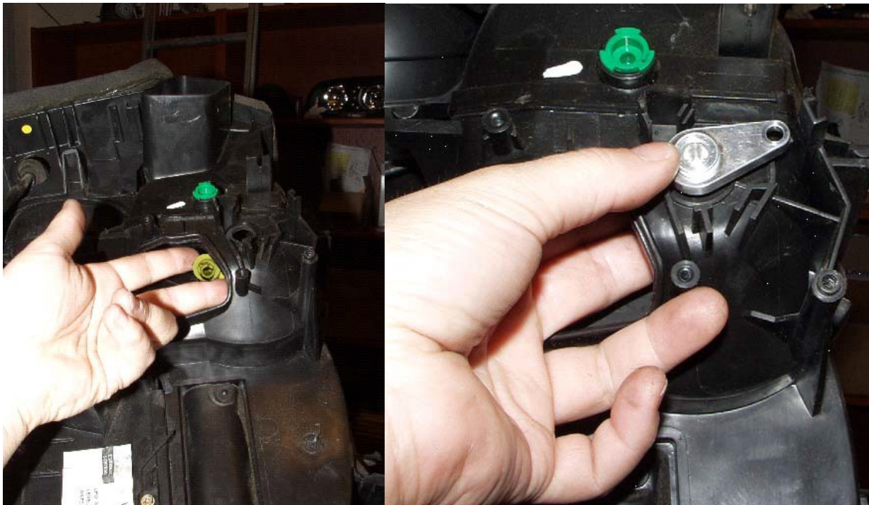
Beide afbeeldingen laten de linkerkant zien. Fig 2